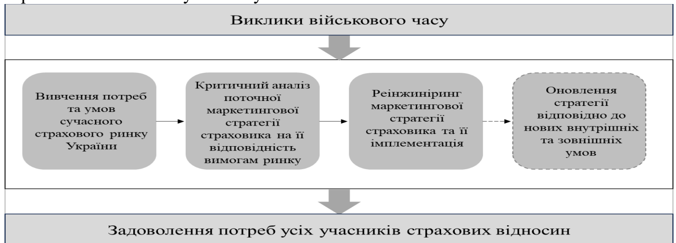
Рис. 1. Базовий алгоритм реінжинірингу маркетингових стратегій страхових компаній в умовах війни

Варто відзначити, що клієнтоцентричність є ключовою особливістю усіх сучасних маркетингових стратегій, основою для розробки яких є вивчення страховиком своєї цільової аудиторії з метою її збільшення. Даний підхід пов'язаний з тим, що в умовах посилення конкуренції, пришвидшення розвитку інновацій та розширення регуляторних обмежень, традиційні маркетингові стратегії є неефективними. Таким чином, можливість створення персоналізованих пропозицій для страхувальників є значною перевагою для страхових компаній в умовах сучасних викликів та змін.